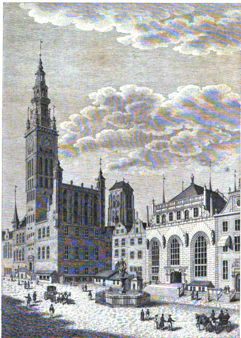
DAS RATHHAUS UND DER ARTUSHOF IN DANZIG.